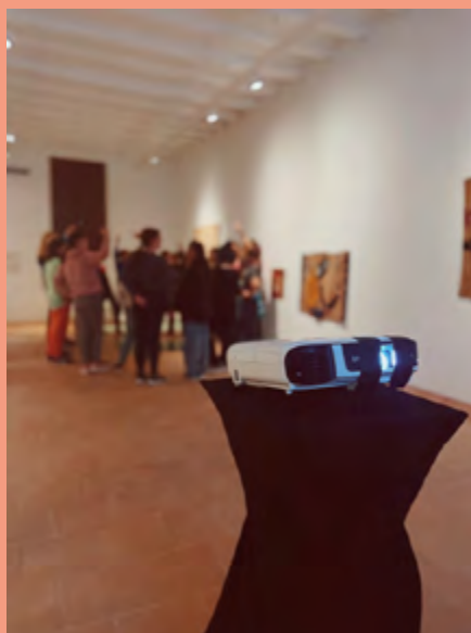
Visita a l'exposició Collecció. Fascicle 4: Escola Catalana del tapís