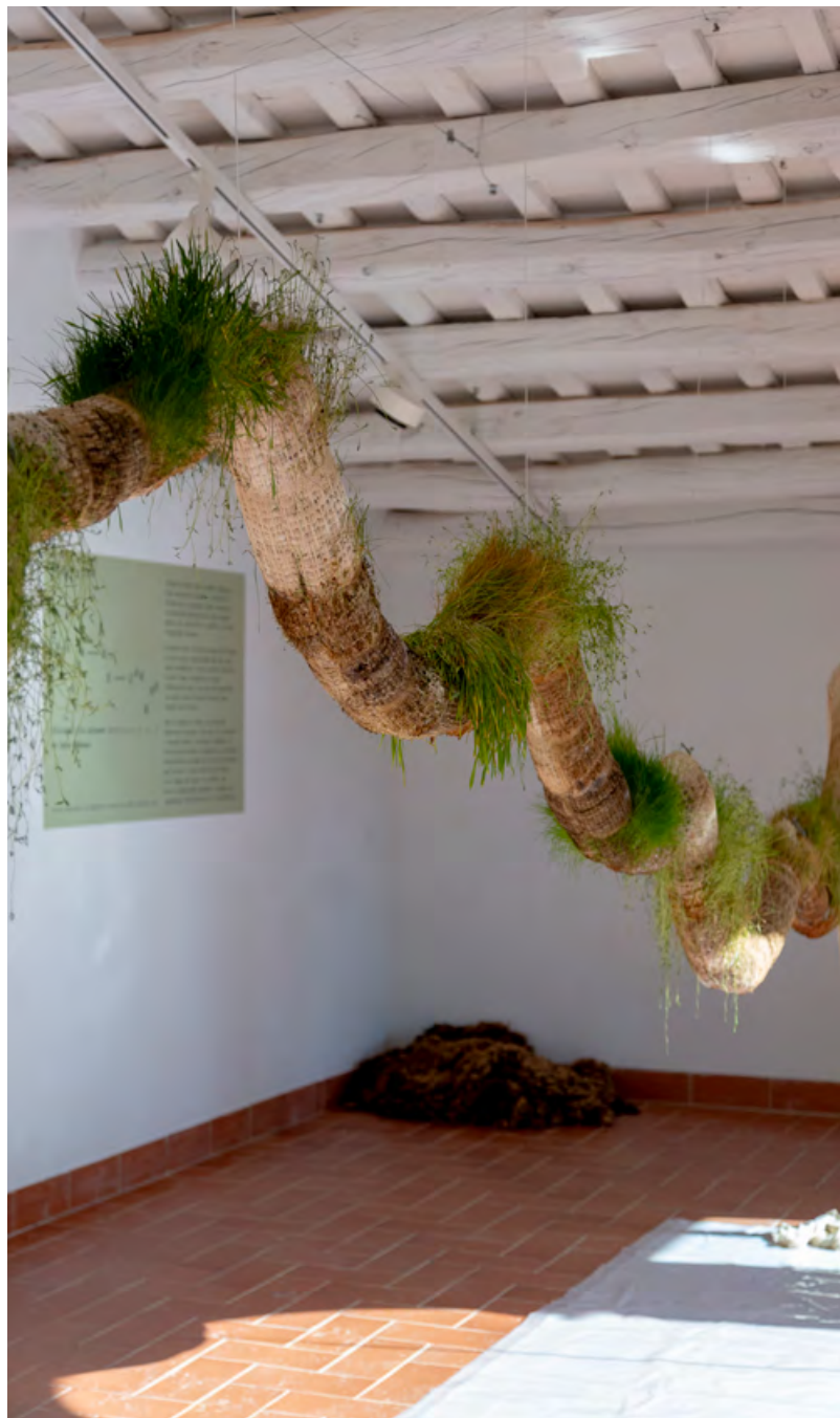
Sala d'exposicions del Centre Grau-Garriga d'Art Tèxtil Contemporani. Vista de l'exposició Caiguda de l'arbre .

Projecte seleccionat a la convocatòria Projecte d'art tèxtil contemporani 2025 Amb el suport de Sorea i el Departament de Cultura de la Generalitat de Catalunya