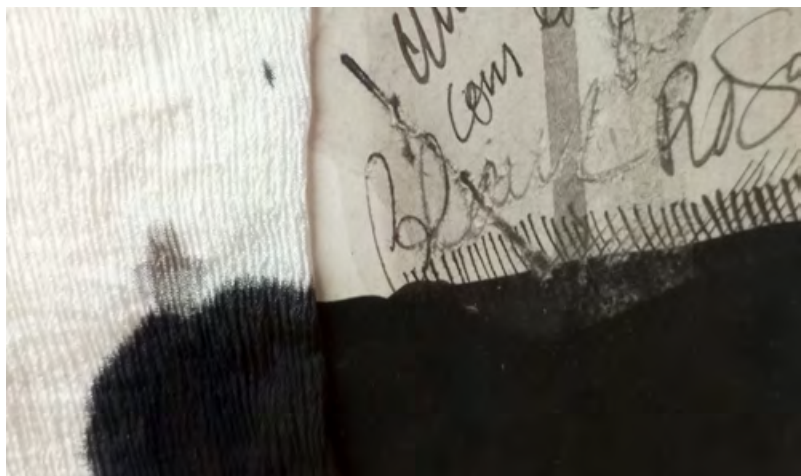
La pell de la pell , Josep Grau-Garriga, 1987 (detall).

Activitats amb aforament limitat. És necessària la inscripció prèvia a través del correu casaymat@santcugat.cat , o bé del telèfon 93 565 70 82.