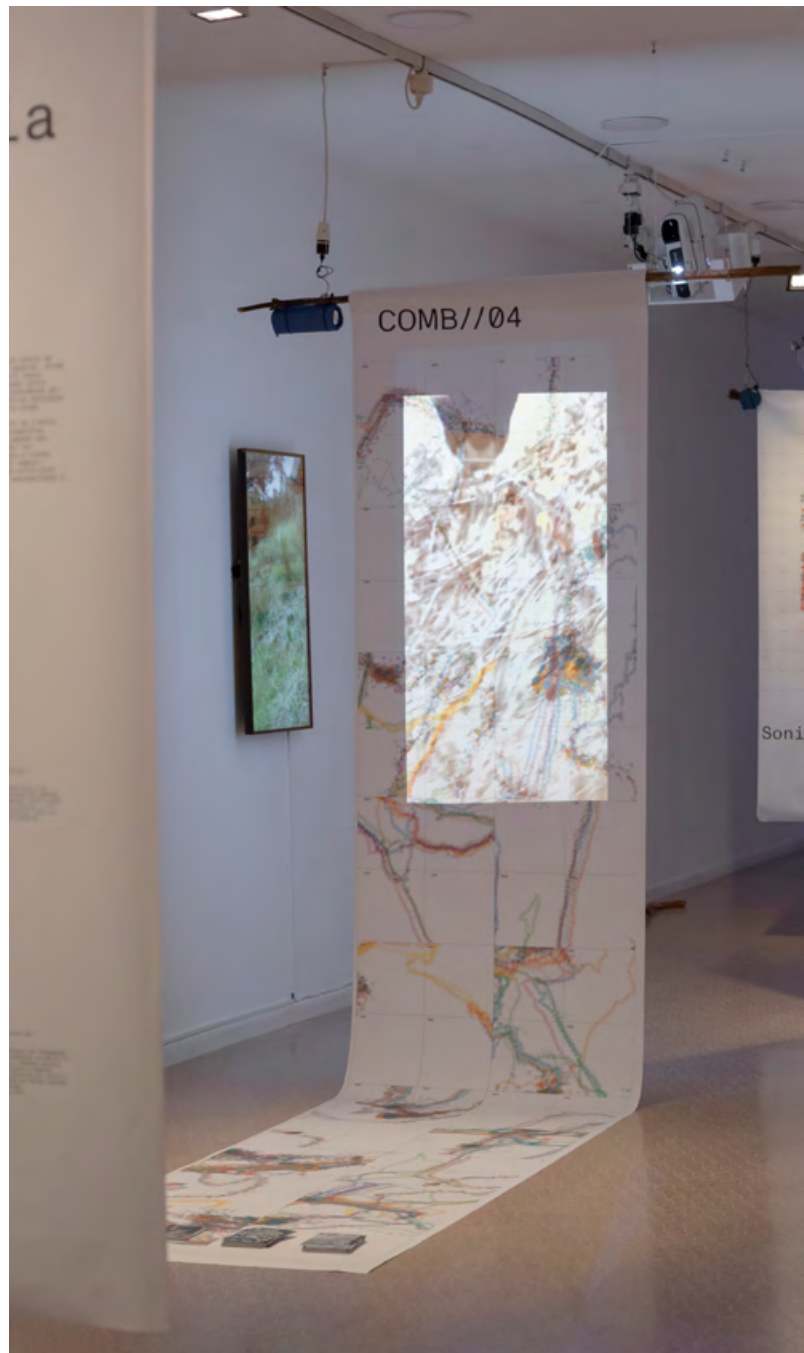
Sala d'exposicions de la Casa de Cultura. Vista de l'exposició Anarqueologia d'un camp .

Amb el suport de Sorea i el Departament de Cultura de la Generalitat de Catalunya