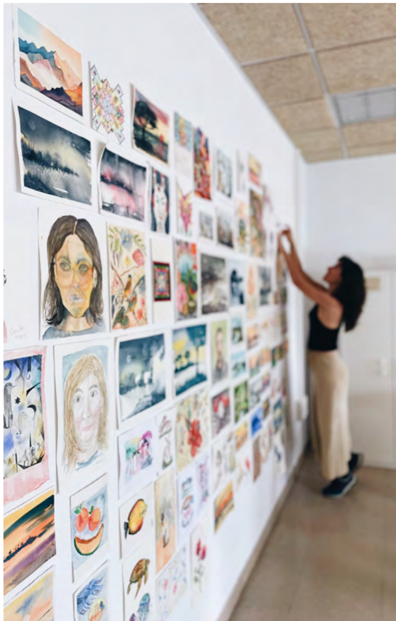
Benvingut Estiu, a Casa Aymat. 2024