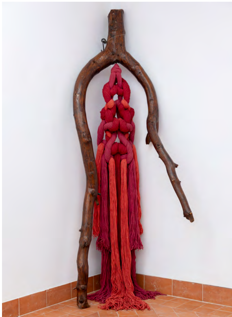
Sala d'exposicions del Centre Grau-Garriga d'Art Tèxtil Contemporani. Vista de l'exposició Col·lecció. Fascicle 5: Singulars .

Activitat amb aforament limitat. És necessària la inscripció prèvia a través del correu casaaymat@santcugat.cat , o bé del telèfon 93 565 70 82.