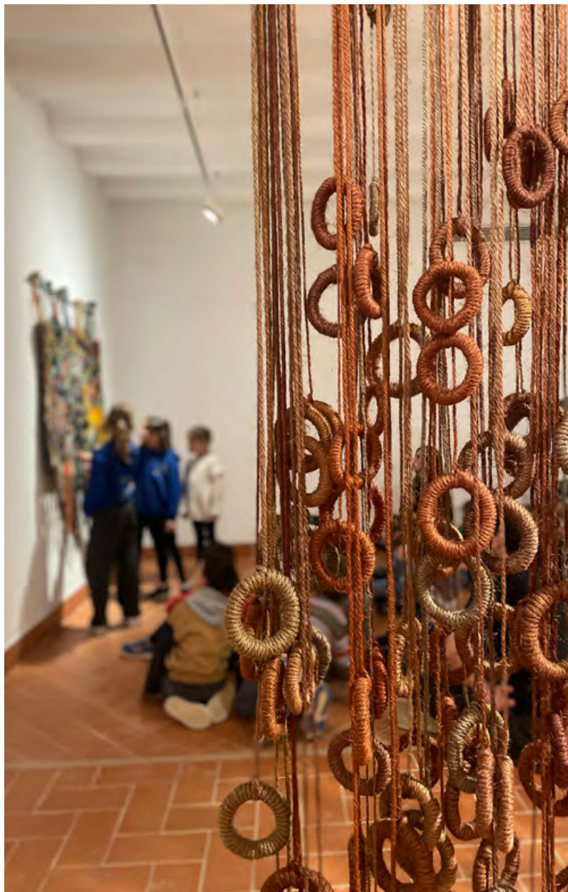
Visita dinamitzada a l'exposició Col·lecció. Fascicle 5: Singulars

Per a més informació o reserves cal fer-ho a través del correu casaaymat@santcugat.cat o bé del telèfon al 935 657 082.