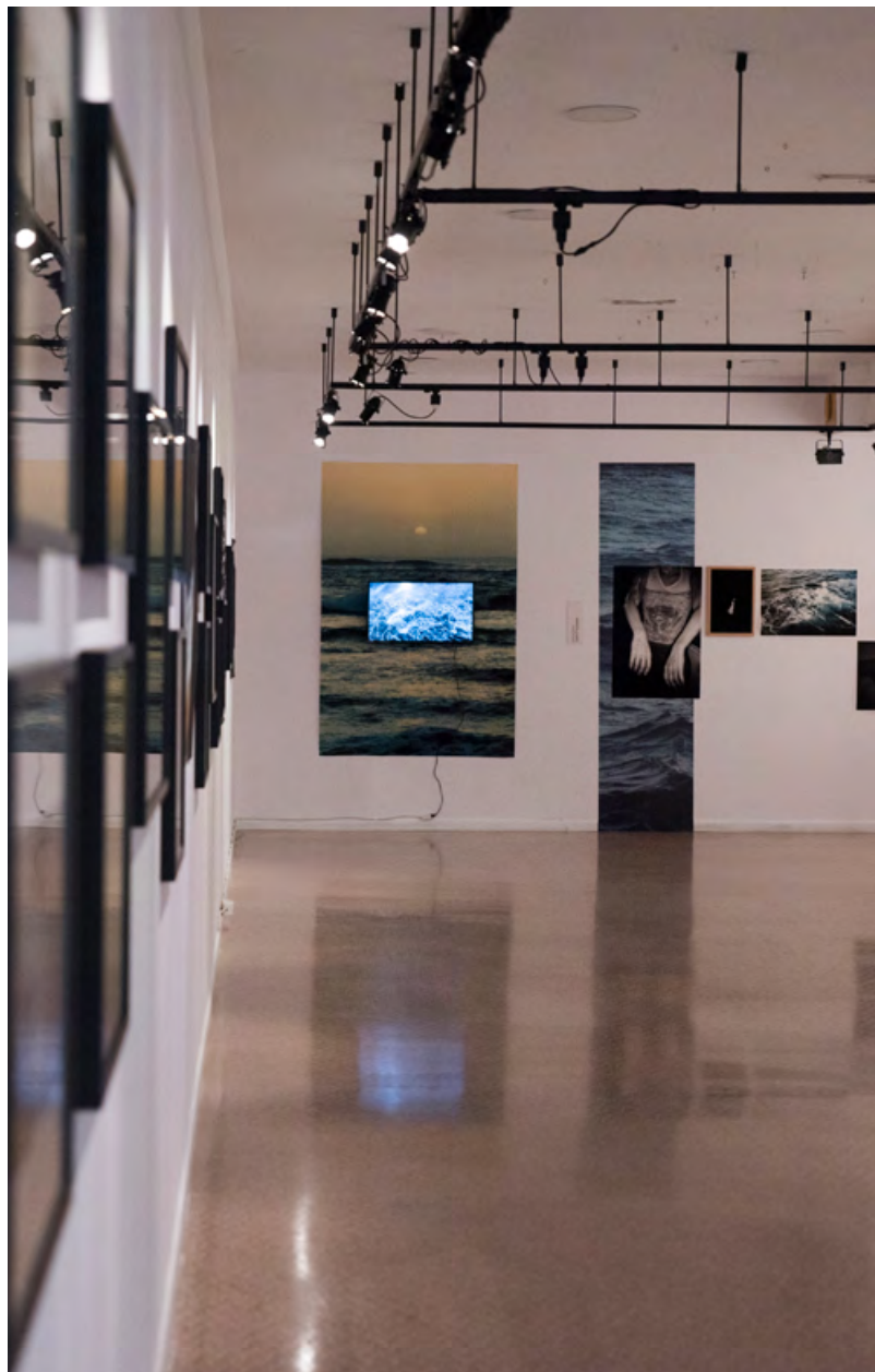
Festival Lumínic 2024.

Consulteu el programa complet del festival al web luminicfestival.com .