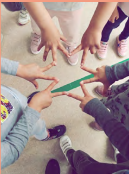
Activació del JO, L'ARTISTA d'Àngels Ribé

Per a més informació o reserves cal fer-ho a través del correu casaymat@santcugat.cat o bé del telèfon al 935 657 082.