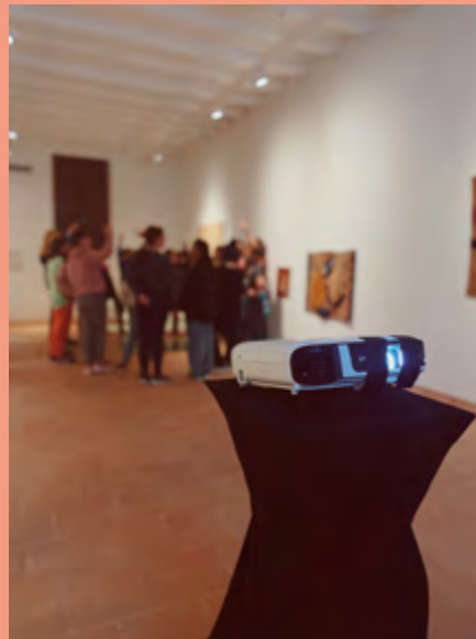
Visita a l'exposició Collecció. Fascicle 4: Escola Catalana del tapís