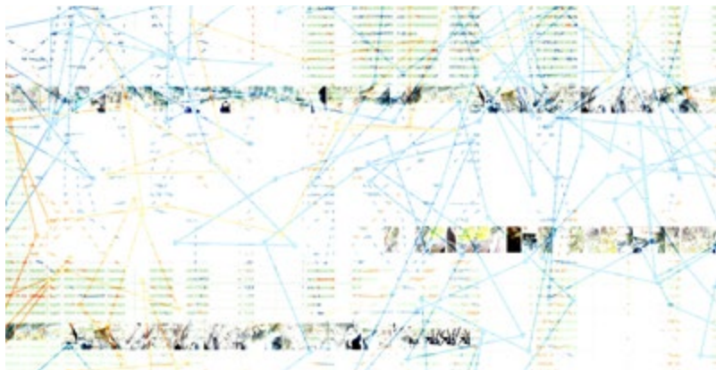
Anarqueologia d'un camp (detall), de Manuela Valtchanova

Activitats amb aforament limitat. És necessària la inscripció prèvia a través del correu casaymat@santcugat.cat , o bé del telèfon 93 565 70 82.