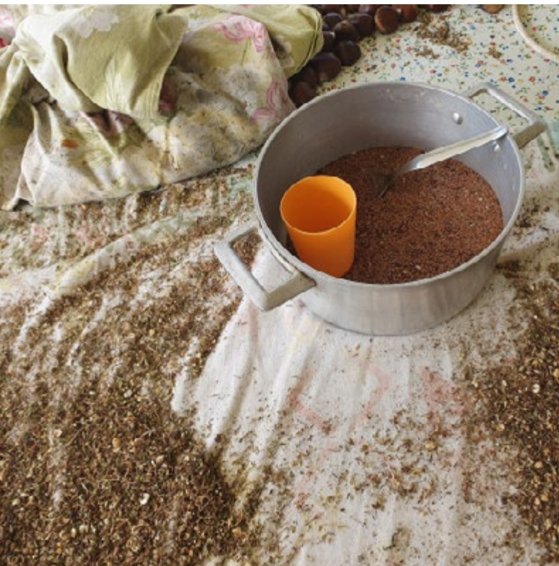
Lembranças de Portugal; la transmissió oral en la cultura popular tèxtil, a càrrec de Mire Garcia Cunill

Presentem un diari de camp que recull la feina de les dones agricultores i artesanes d'AmaCastelões, una associació que manté viva la tradició del cicle del lli des d'una aldea a la regió central de Portugal. Posarem en valor la transmissió oral, històricament lligada a les pràctiques tèxtils, i compartirem coneixements populars en risc de ser oblidats.