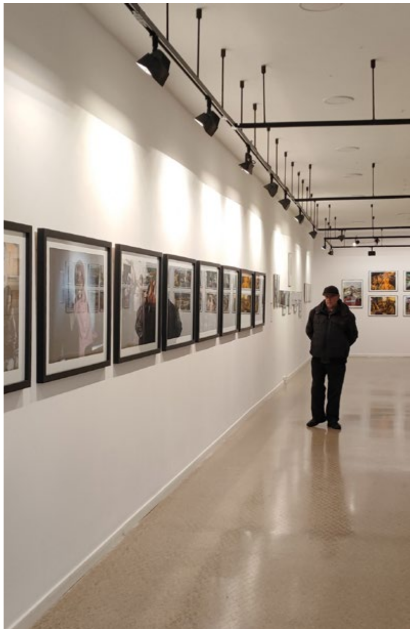
Sala d'exposicions de Casa de Cultura. Vista de la 6a Biennial Qgat Foto. F = m \cdot a .

De les 24 exposicions que es presenten a la Biennial, 22 es podran veure a Sant Cugat. Les acullen els següents espais: la Casa de Cultura , l' Ateneu Santcugatenc , la Cooperativa Abacus , la Biblioteca Gabriel Ferrater , la Biblioteca Miquel Batllori , el Casal de Mira-sol , el Claustro del Monestir de Sant Cugat , el Casino La Floresta , i els comerços Pou d'Art i Zumzum . Les altres dues exposicions es presentaran a Barcelona gràcies a la col·laboració dels laboratoris fotogràfics VisualKorner .