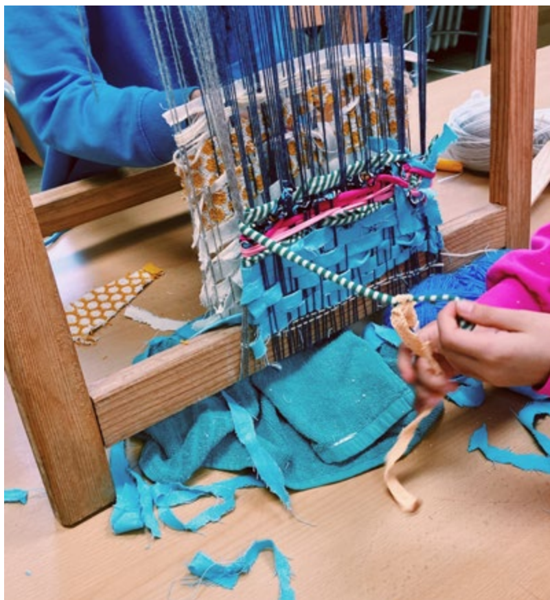
Taller El teixit en construcció. L'art tèxtil a Sant Cugat , dut a terme a l'alumnat de 5è i 6è de l'Escola Joan Maragall.

Per a més informació o reserves cal fer-ho a través del correu casaymat@santcugat.cat o bé del telèfon al 935 657 082.