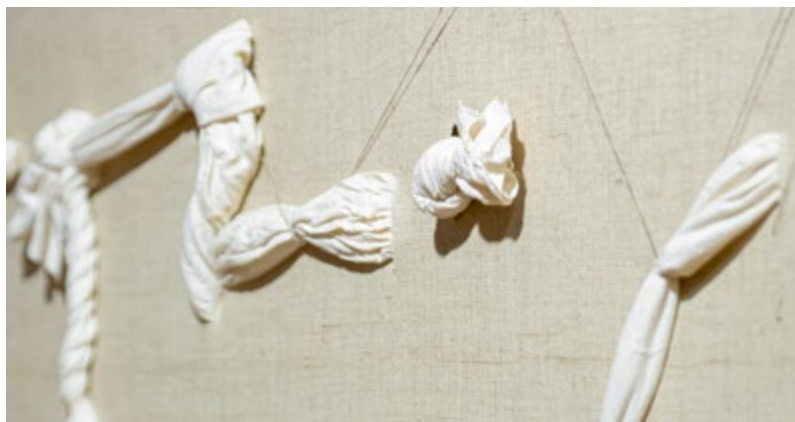
Maria Teresa Codina. Imatge blanca i estel , 1982. (fragment). Dipòsit Generalitat de Catalunya.

Activitats amb aforament limitat. És necessària la inscripció prèvia a través del correu casaaaymat@santcugat.cat , o bé del telèfon 93 565 70 82.