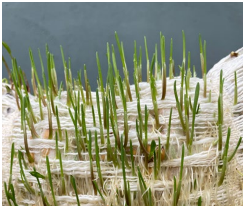
Caiguda de l'arbre , de Carla Mañosas.

Activitats amb aforament limitat. És necessària la inscripció prèvia a través del correu casaymat@santcugat.cat , o bé del telèfon 93 565 70 82.