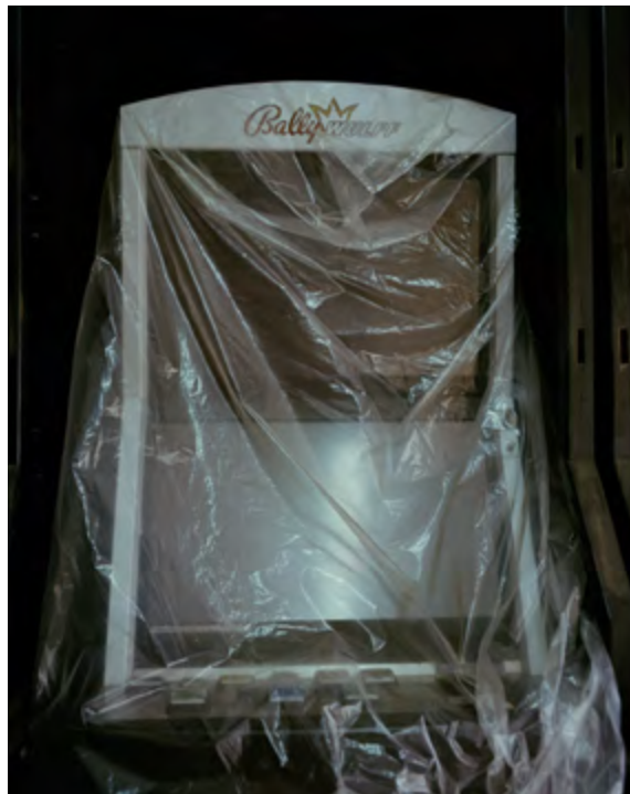
Esfera Oculta, 2024

En aquestes imatges l'artista no busca la bellesa, sinó que l'interessa que reflexionem en coses que hi són o no hi són, es fixa en espais o cossos que no són disponibles o accessibles per a tothom. O bé, en coses que no fan la funció que farien habitualment com és el cas de les màquines de joc.