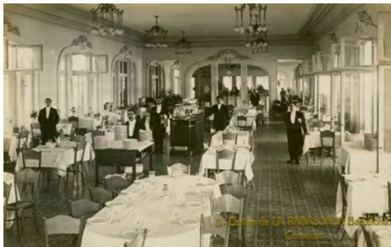
Casino de la Rabassada, Barcelona. Menjador (c. 1911), fotografia de Lucien Roisin. Arxiu Municipal del Districte de Gràcia

Activitats amb aforament limitat. És necessària la inscripció prèvia a través del correu casaaumat@santcugat.cat , o bé del telèfon 93 565 70 82.