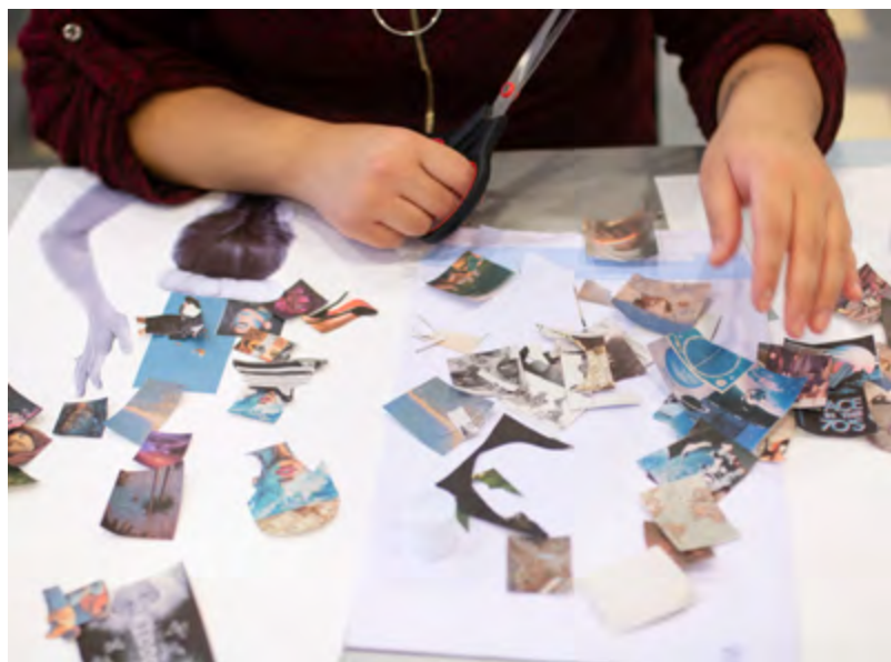
Imatge de procés, © Marta Fàbregas i Berta Navarro

Visita guiada , a càrrec de Marta Fàbregas i Berta Navarro