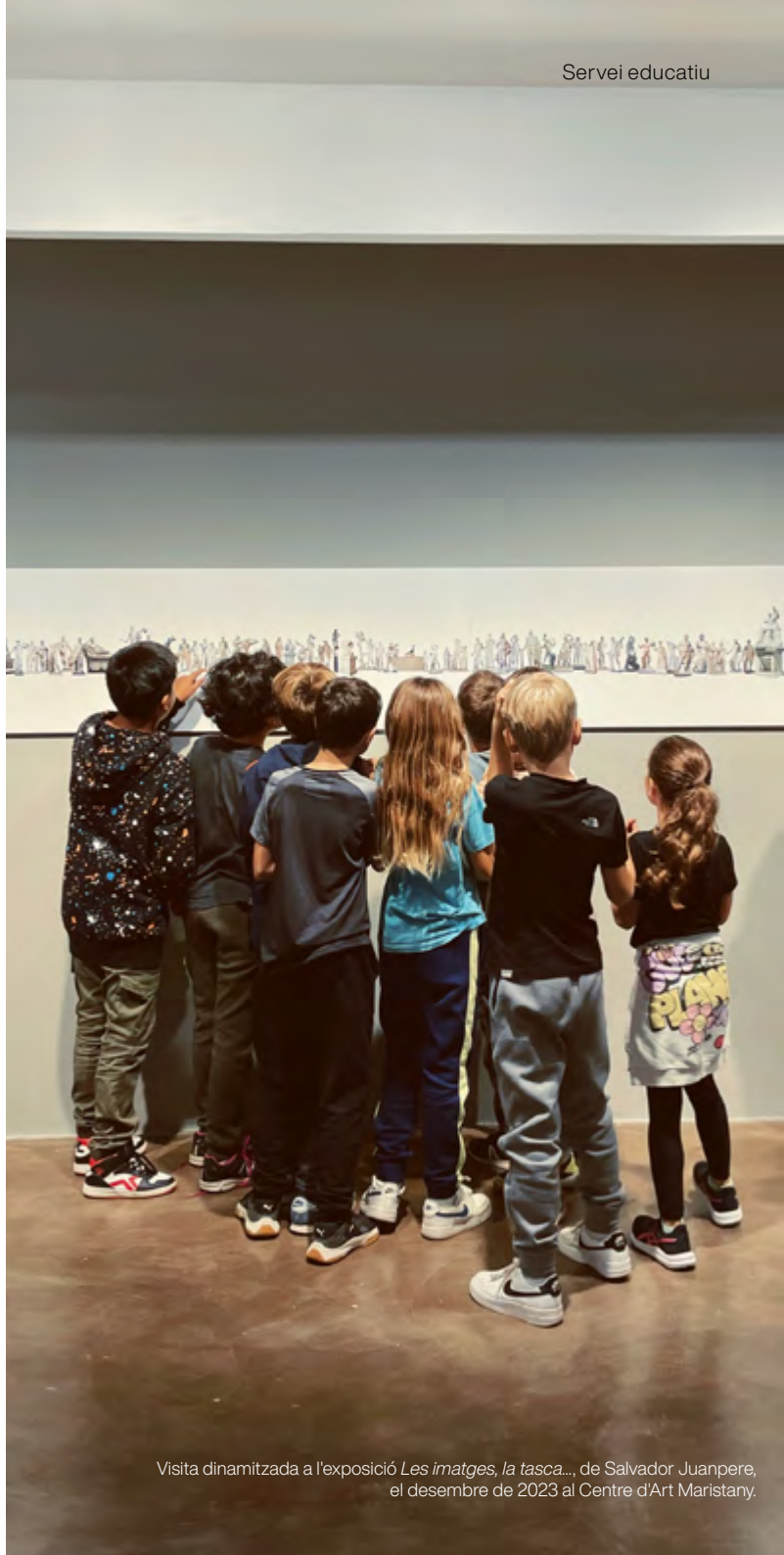
Visita dinamitzada a l'exposició Les imatges, la tasca... , de Salvador Juanpere, el desembre de 2023 al Centre d'Art Maristany.

Per a més informació i reserva de grups, adreçar un correu a casaaymat@santcugat.cat o truca al 935 657 082