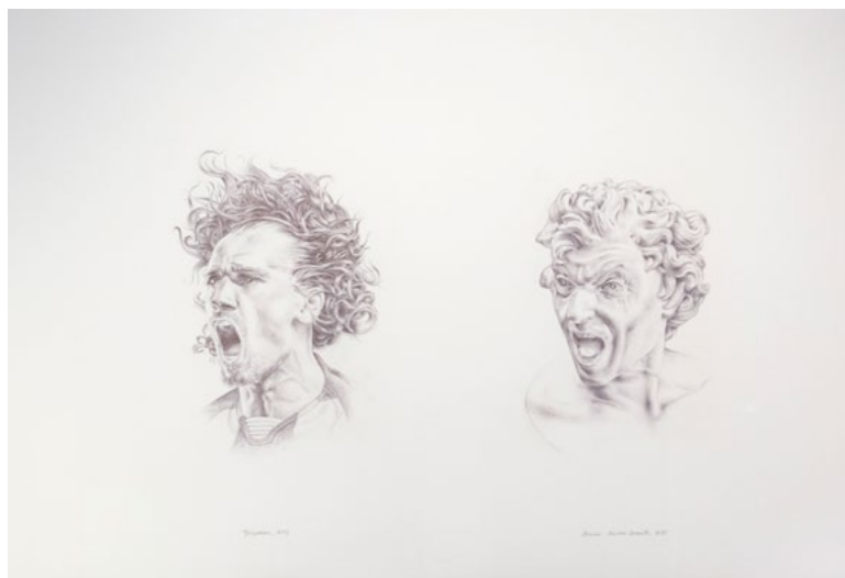
De la sèrie Entretiens avec... (2020-2022)