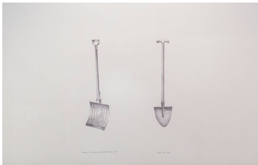
De la sèrie Entretiens avec... (2020-2022)