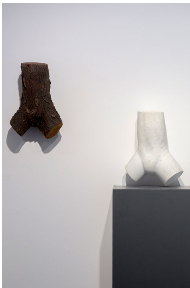
Torse de jeune home (...après de Brancusi) (2023)