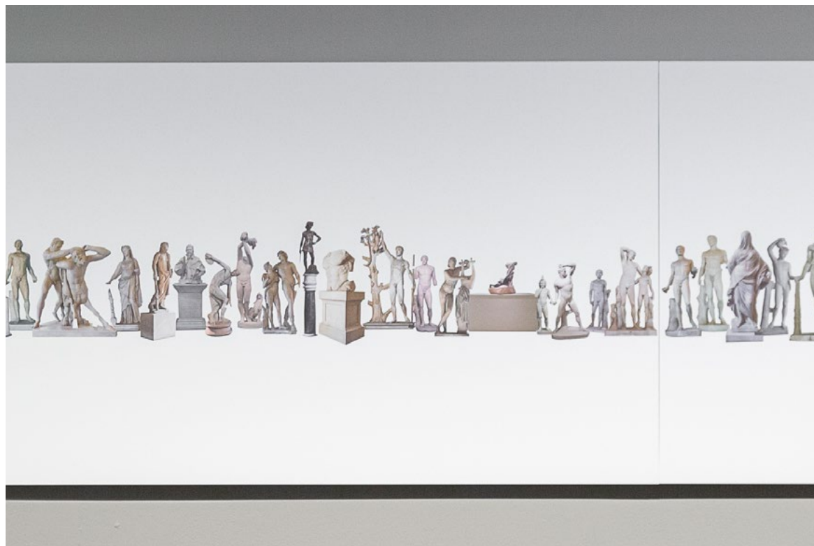
Fris d'escultures.... (vulnerables) (2022)

A la sèrie puntellis mostra una taula plena d'aquests fragments, i un fris amb totes les imatges d'aquelles escultures de les quals n'ha estudiat aquest mecanisme i l'ha reproduït. En aquestes imatges fa desaparèixer els puntellis que ha replicat. D'alguna manera, ens ensenya el truc que ha permès que aquestes peces perdurin en el temps , i a la vegada fa protagonista aquest element que habitualment és invisible a la nostra mirada.