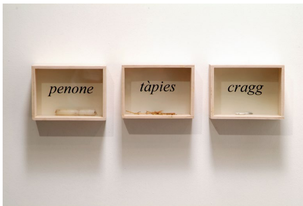
Furts . “ Y dios puso al mundo la belleza para que fuera robada ” (2005)

Per entendre fins a quin punt en Salvador és fan d'alguns artistes us explicarem què va fer a a la peça Furts . “ Y dios puso al mundo la belleza para que fuera robada ” (2005). En aquest treball presenta unes capses de vidre on podem veure una sèrie d'elements que relaciona amb uns noms que hi ha inscrits a la capsa. Quina associació proposen aquests materials i aquests noms?