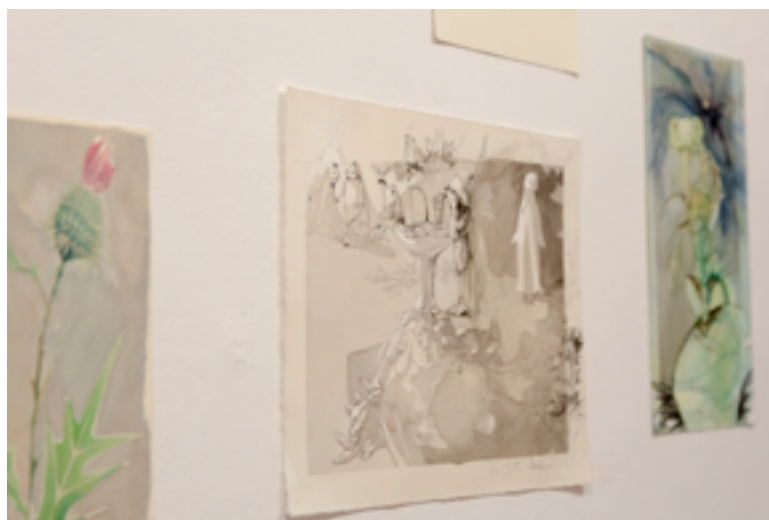
El teatre de les plantes , 2023. Detalls d'alguns dibuixos i aquarel·les

Arriba el 2023, i presentem l'exposició El teatre de les plantes , a la Casa de Cultura de Sant Cugat del Vallès. Un projecte seleccionat a la convocatòria de Projectes artístics de ciutat 2023. Amb aquest nou projecte vam fer un gir, enfocant la nostra mirada cap a la naturalesa. El punt de partida de la nostra recerca és comprendre els éssers vegetals com a organismes conscients. A partir d'aquí, explorem moltes referències bibliogràfiques, estudis botànics, científics, literaris, i comencem a pensar en les possibilitats visuals i poètiques que sorgeixen quan tractem d'imaginar l'existència des de percepcions diferents de la temporalitat i el desplaçament humans.