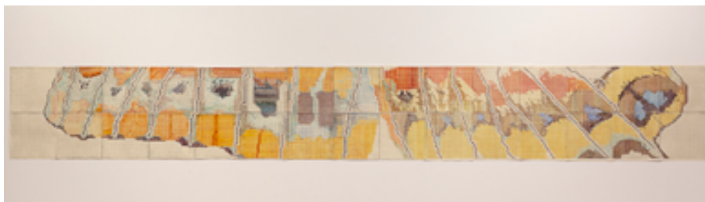
Ala de papallona de Charaxes Jasius, 2023. Aquarel·la i gravat sobre 32 papers. 40 x 320 cm

Monica Kopatschek tria les taques de l'ala de papallona com a referència, i d'esquerra a dreta troba, la figura d'una eruga, i el seu pas per l'arbust fins a transformar-se en papallona. Pots veure-les tu també?