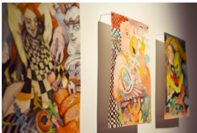
Se acabaron las bacanales , 2023 Aquarel·les de la sèrie

Les estructures socials i les emocions humanes són una font d'inspiració i per tant, una temàtica recurrent en la nostra obra. A través de les experiències pròpies, creem mons paral·lels plens d'històries i personatges que en són un reflex del món en què vivim.