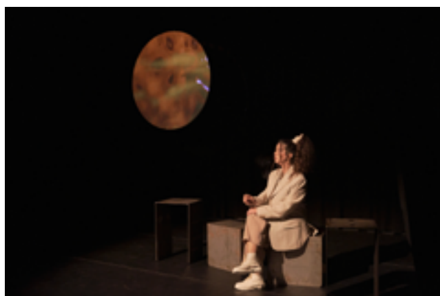
Por siglos en Eros , 2022. Diferents escenes de la representació