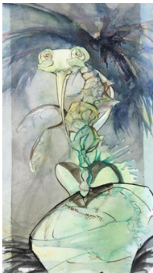
Insecte amb para-sol, 2023. Aquarel·la i guaix sobre paper. 18 x 39 cm