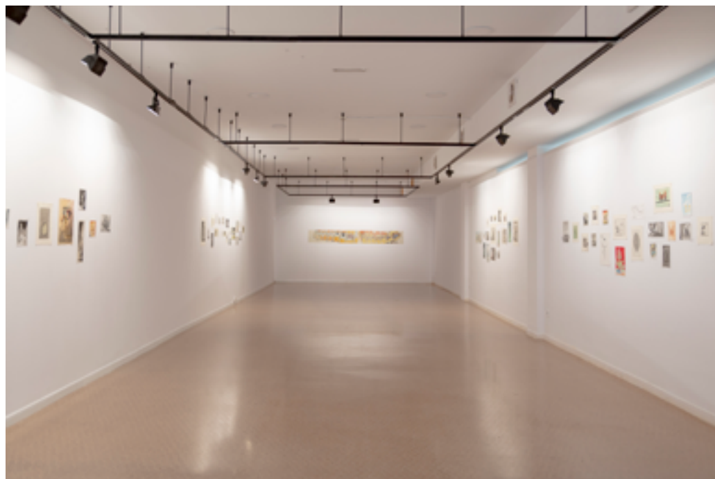
El teatre de les plantes , 2023. Vista general de la sala d'exposicions a la Casa de Cultura de Sant Cugat del Vallès.