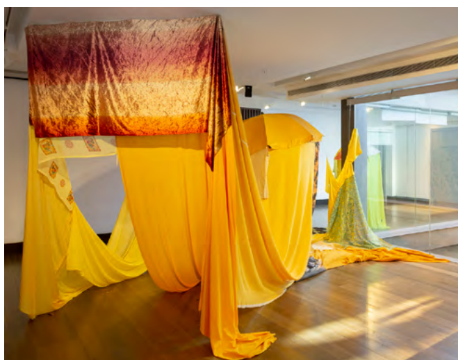
Instal·lació Carrier Wave (Ona Portadora) al Centre d'Art Maristany

La Rosa va convidar a 8 performers per concentrar-se en l'acció del riure, un riure que vol despertar el riu i l'aigua que tant ens fa falta ara mateix. De manera, que aquest personatge que sembla un drac xinès, que l'artista anomena Carrier Wave , té la missió de sacsejar amb el seu riure la terra, per fer-la riure fins que plougui.