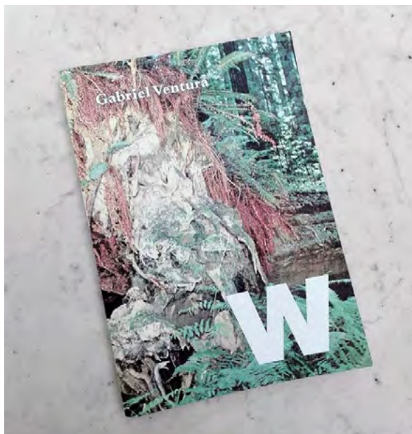
W. Gabriel Ventura © Cortesía de l'artista

I, fins i tot, ha fet d'actriu. Ha participat a Història de la meva mort d'Albert Serra o a la Sèrie de 10 poemes-guió per la pel·lícula ULLS/ULLS/ULLS/ULLS d'Albert García-Alzórriz, presentada al Pavelló Català de la Biennal de Venècia, 2019.