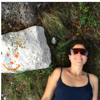
Rosa Tharrats © Cortesía de l'artista