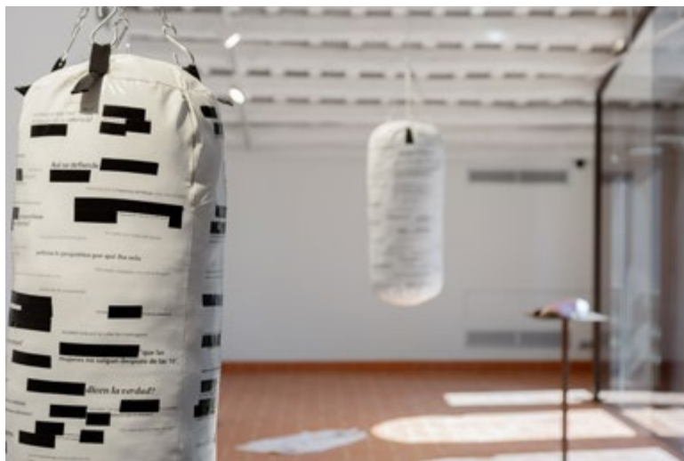
Leia Goiria, De camí a casa... (2019)

A més a més, a les dones se'ns diu des de petites que no som prou fortes per defensar-nos.