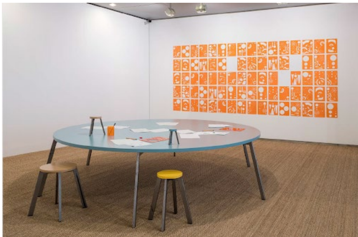
El sol i la taula , 2019 Can Palauet, Mataró

El sol i la taula (2019) és una altra exposició individual de Regina Gimenez on es pot apreciar molt bé l'evolució formal del seu treball. La mostra va tenir lloc a Can Palauet, Mataró, i permet veure com l'artista surt en aquest cas de la pintura per endinsar-se en altre registres com l'escultura, la instal·lació i, fins i tot, incorpora registres lúdics de caràcter més processual i performatiu. En aquest sentit, i prenent com a punt de partida una imatge antiga dels planetes del Sistema Solar, l'artista incorpora tot un espai relacional amb taules circulars que reproduïxen les mides dels planetes i regles per a dibuixar.