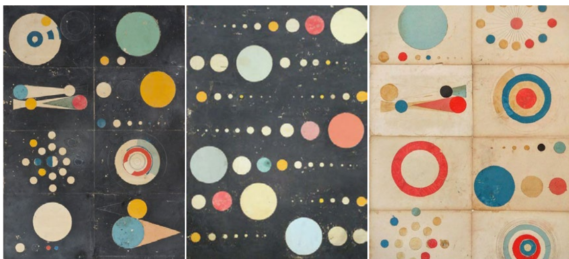
Geometria còsmica, 2012 Tècnica mixta sobre paper o tela

Fixa't com ho ha fet la Regina Gimenez en la seva sèrie d'obres titulades Geometria còsmica . En aquest cas, l'artista es va fascinar amb les imatges del cosmos d'un llibre antic sobre l'univers. Com si es tractés d'un collage, ella va anar agafant les formes que li agradaven i les va alliberar de la seva informació. Després del seu procés artístic, Geometria còsmica ja no ens ajuda a conèixer els noms dels planetes i les constel·lacions, però en canvi ens permet veure la seva essència des de l'àmbit de l'art. En un exercici constant de macro (l'univers) a micro (una pintura, un dibuix), Regina Gimenez juga amb les escales i les formes. En el fons, Geometria còsmica sembla un joc de construccions capaç d'imaginar infinites possibilitats mitjançant tota una sèrie de formes preconcebudes. Veiem planetes, òrbites, cometes. En definitiva, veiem el món i, a la vegada, ens alliberem d'ell.