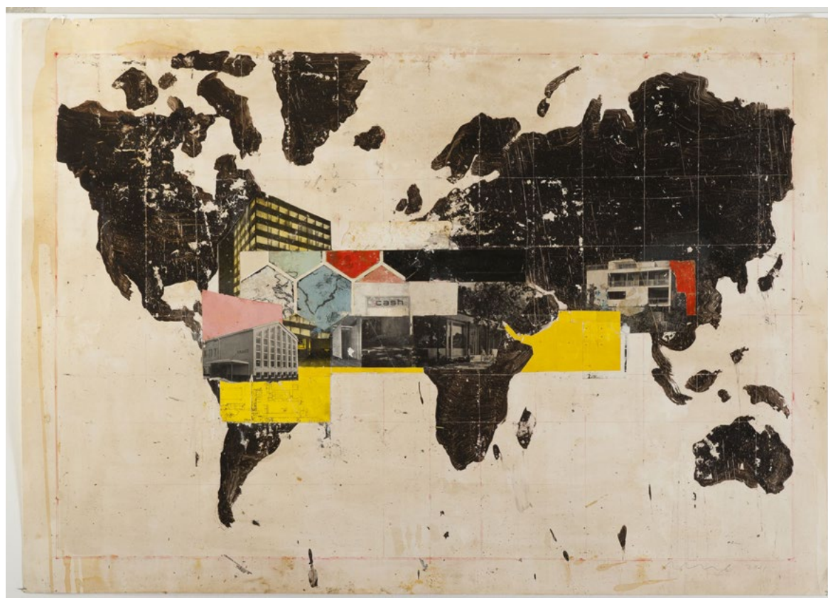
Símbols convencionals , 2012 Museu d'Art de Tarragona

L'any 2012, Regina Gimenez va mostrar al Museu d'Art de Tarragona l'exposició Símbols convencionals , una exposició on el mapamundi servia com a eix central d'un treball pictòric que es nodria de forma i color, però també de retalls de fotografies propis del món de l'arquitectura moderna que apareixien alliberats de la seva ubicació geogràfica. Així, els mapamundis de l'artista abandonaven la seva coherència en favor de la intuïció, l'atzar i la fantasia.