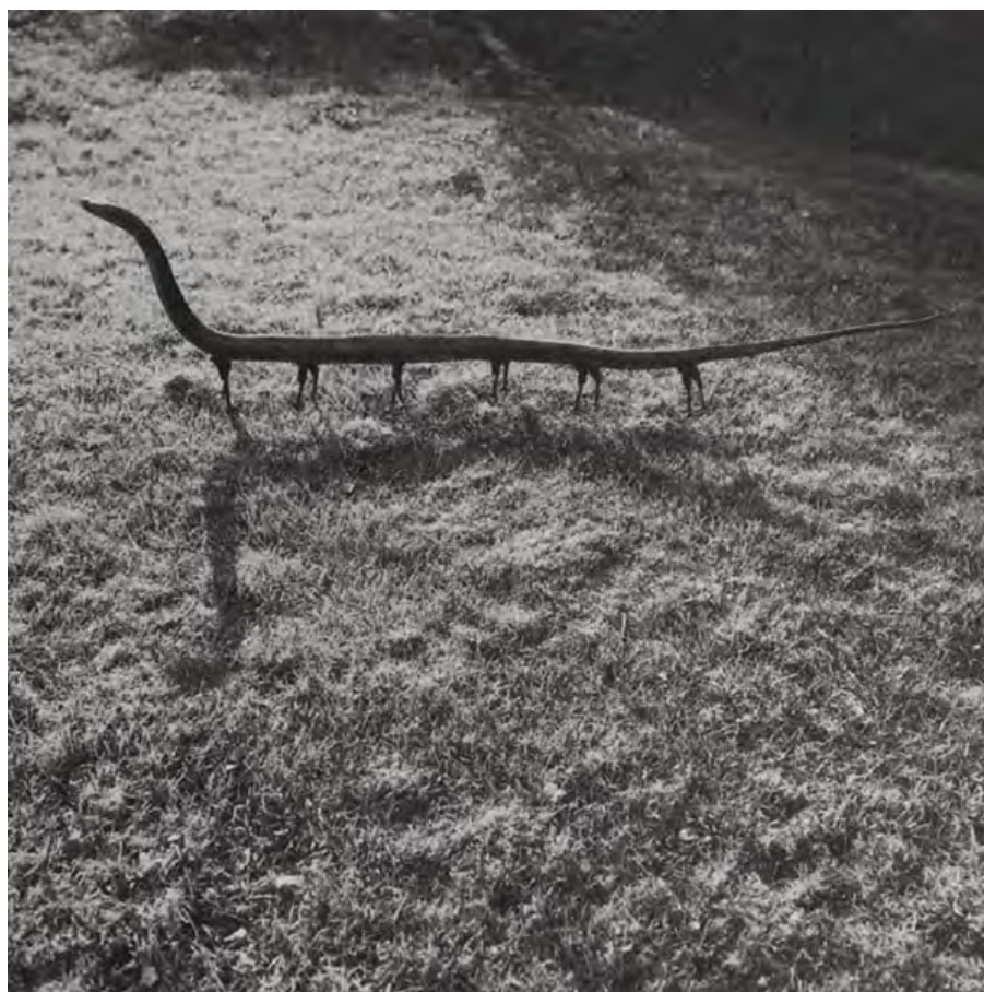
Sèrie "Fauna"

2. El seu projecte Fauna parla sobre la veracitat i que, juntament amb l'artista Joan Fontcuberta, recrea la biografia d'un zoòleg alemany (Peter Ameisenhaufen, que en alemany significa Pere Formiguera ), descobridor d'una nova fauna tan oculta com fantàstica, inventant l'existència d'animals fantàstics. En aquest treball, Formiguera va crear principalment la història de ficció i Fontcuberta va fer les fotografies.