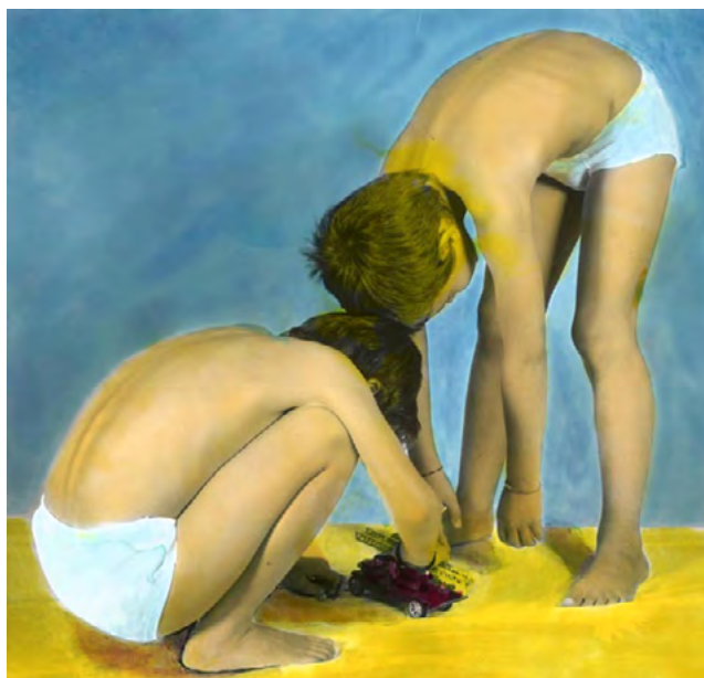
Fotografies: Pere Formiguera Sèrie "Diàlegs amb la pintura"

En les seves fotografies reconeixem la influència de la pintura i personatges coneguts de la història de l'art, com són l'Arlequí de Picasso o els bodegons de Cézanne.