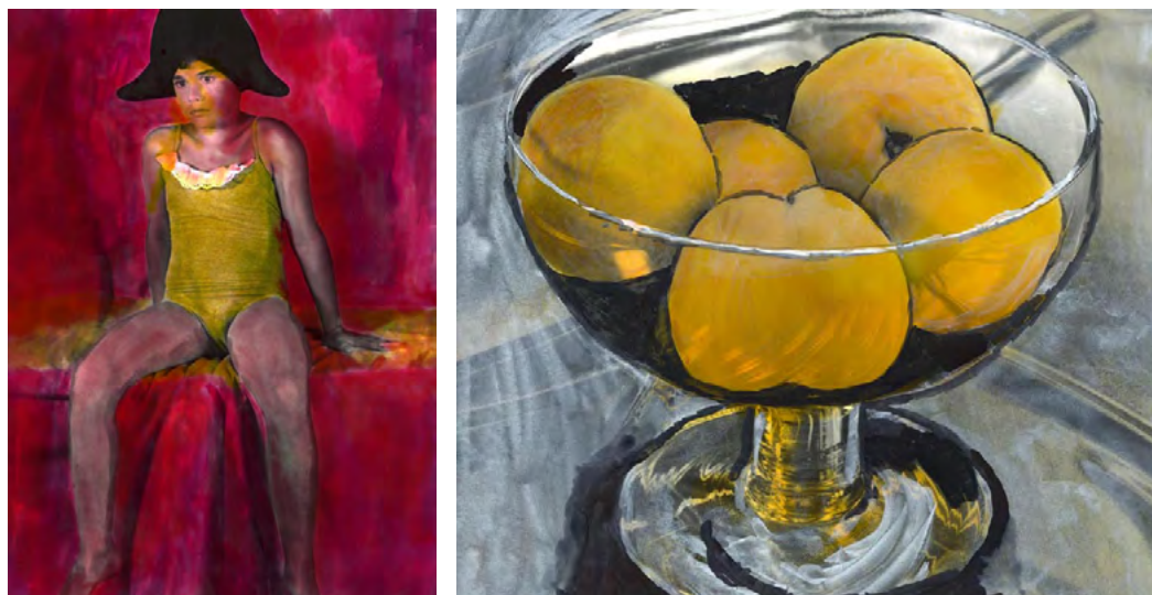
Fotografies: Pere Formiguera Sèrie "Diàlegs amb la pintura"

Pere Formiguera inicia la seva carrera artística als anys '70 i és considerat un dels fotògrafs més importants de la seva generació i la fotografia creativa a Catalunya. Els seus treballs giren entorn del retrat i la manipulació fotogràfica, encara que també del paisatge. L'autor juga, entre d'altres, amb els conceptes del pas del temps i la veracitat, elevant la fotografia com activitat artística i no només com a document.