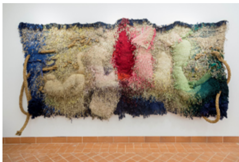
Temps tendre, 1984. Tapís. Cànem, fibres sintètiques, cotó, espart, llana i seda. 200 x 450 cm

A finals de la dècada dels '50 s'endinsarà en el món del tapís. Amb Grau-Garriga els tapissos deixaran de ser quadres teixits i guanyaran nous terrenys amb l'ús de fibres vegetals pobres i l'expressió a través de la matèria i els volums.