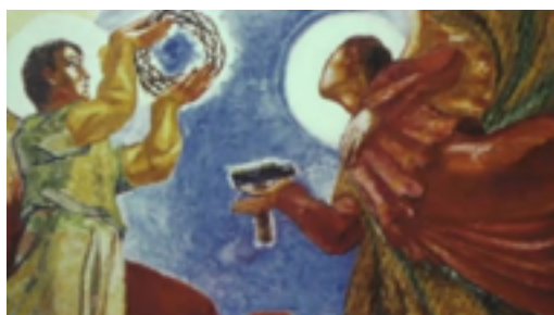
Pintura mural (fragment), 1956 Ermita de Sant Crist de Llaceres, Sant Cugat del Vallès.