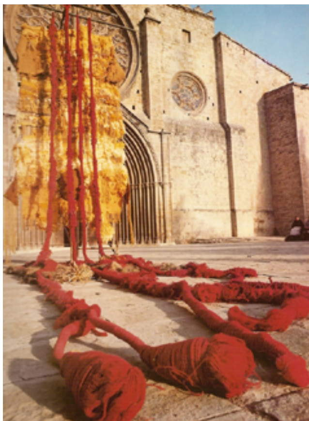
Monument a l'esperança , 1973 Tapís-escultura. Llana, jute, cànem i fibres sintètiques. 550 x 230 x 450 cm Instal·lació al Monestir de Sant Cugat

En el cas de la pintura, l'ús del collage tèxtil i objectes personals s'aniran integrant cada vegada més als seus treballs fins al punt que els teixits no seran concebuts com a objectes adherits sinó com una part matèrica més de la pintura.