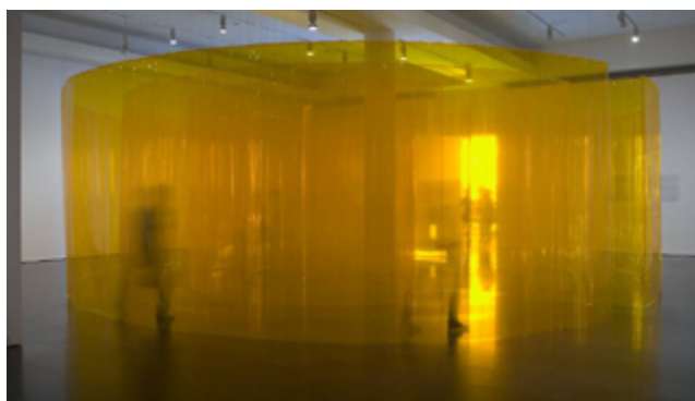
Laberint , 1969 Instal·lació