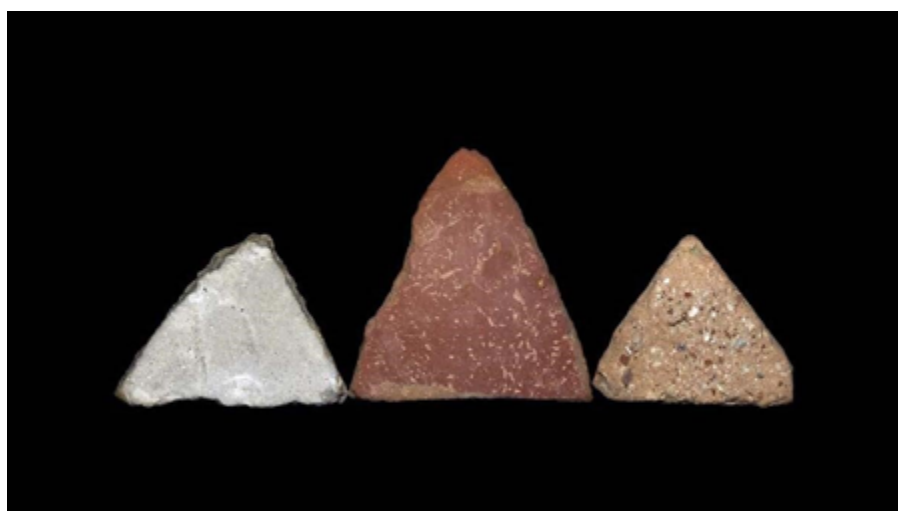
My mountains , 2019 Registre fotogràfic

4. Actualitat. Al llarg de la seva vida, Àngels Ribé ha col·leccionat tot tipus de pedres que s'han creuat al seu camí. Amb aquesta peça fotogràfica, uneix dos dels seus interessos a les darreres obres realitzades: la natura i la escultura, tal com podem veure a My Mountains , 2019.