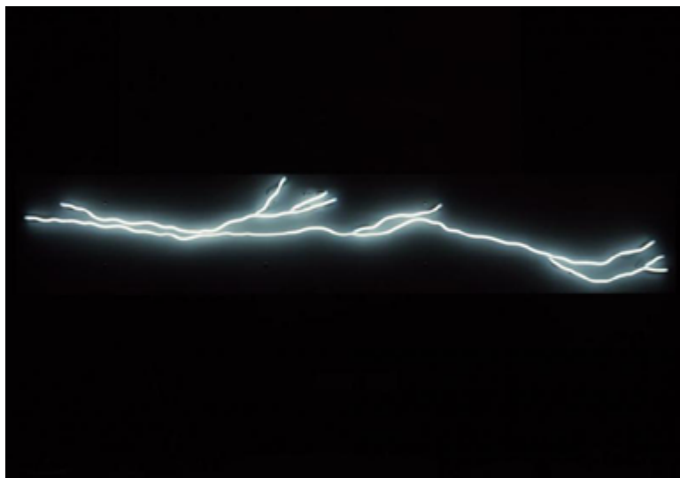
Campo Abierto , 2003 Neó

3. Als '80 torna a Espanya i recupera la naturalesa objectiva de l'obra d'art a través de l'escultura. Comença a treballar amb ferro i més cap als 2000 amb llums de neó.