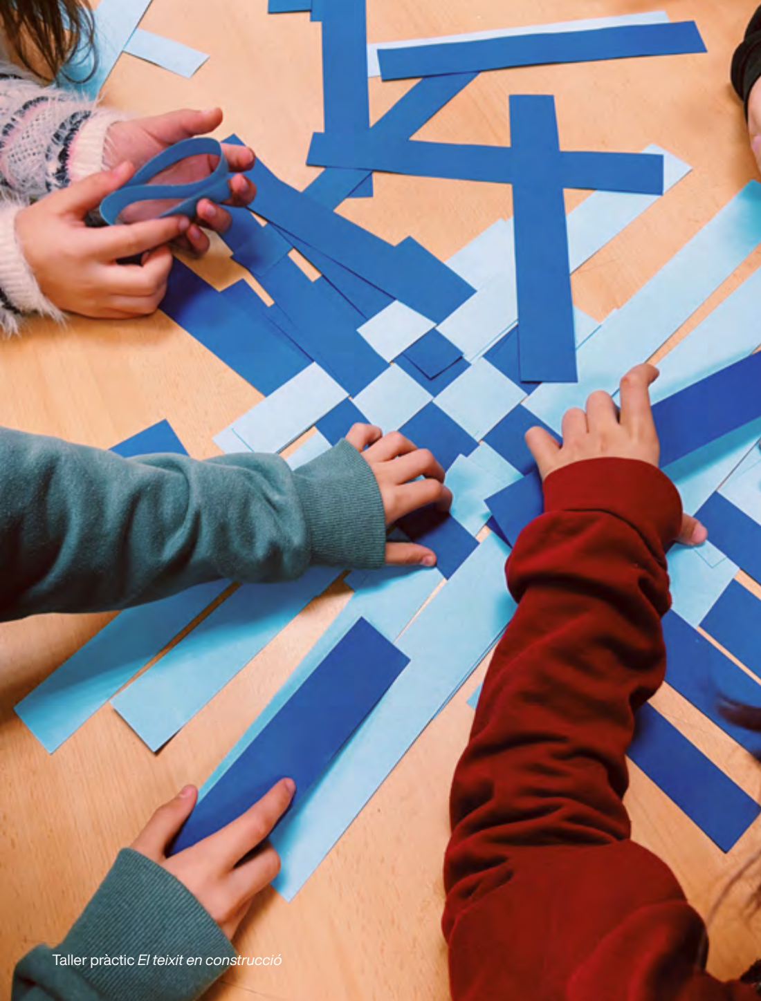
Taller pràctic El teixit en construcció