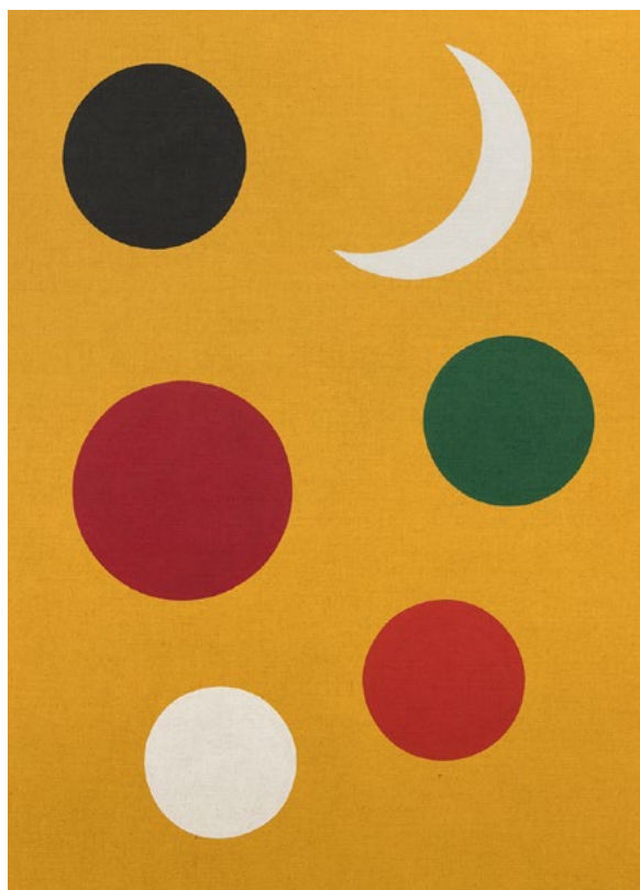
Nit (grogas) , 2020 200 x 145 cm, acrílic sobre jute

El manual en contraposició a l'hiper-industrialitzat.