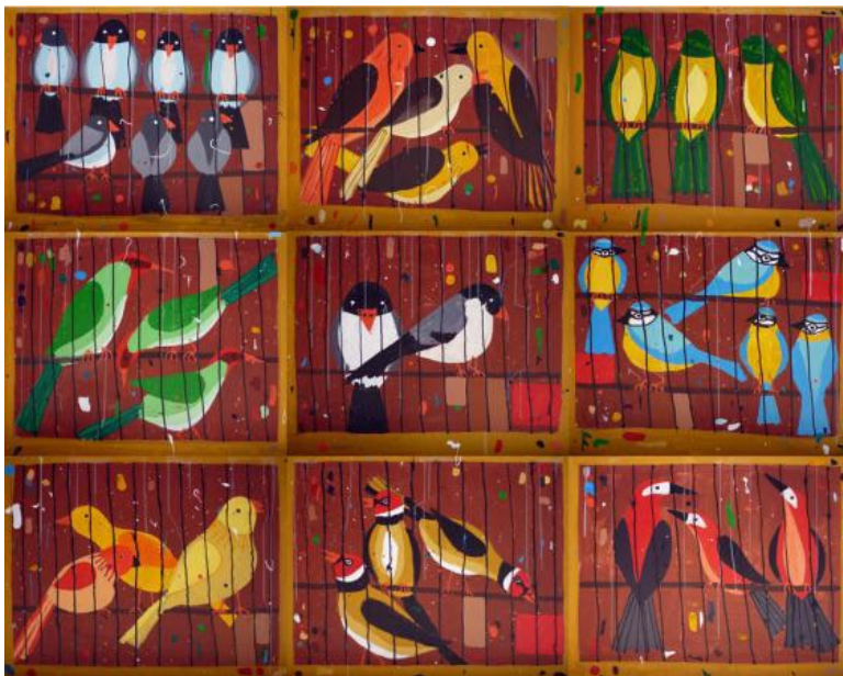
Ocells en gàbies , 2010. Acrílic sobre llenç, 219 x 276 cm

No es considera innovador amb aquesta cerca de l' essència , artistes de les primeres avantguardes del S.XX ja ho feien. Decideix aquest tipus de representació per a rebel·lar-se davant una realitat artística on tot es produeix o presenta.