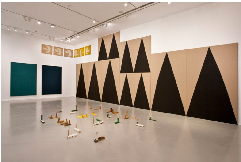
Vista de l'exposició ¡Vivan los campos libres de España! La Casa encendida. Madrid, 2017.