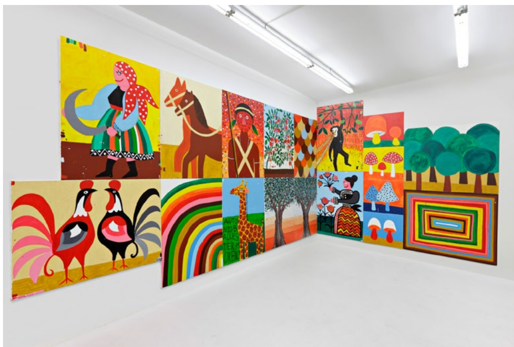
Vista de l'exposició ANTI-MITTE, Peres Projects, Berlín, 2010.