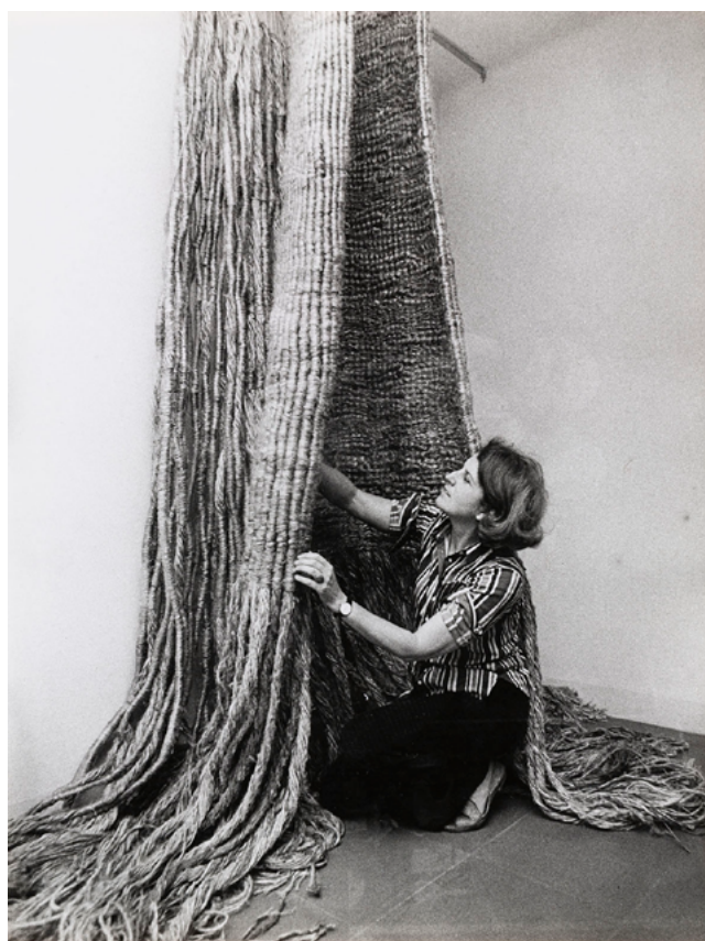
Aurèlia Muñoz treballant el jute natural (1977)

Atreta per l'experimentació i recerca tècnica constant, eleva a categoria artística el que fins aleshores era considerat artesania. Utilitzant fibres naturals i vegetals, la investigació sobre l'obra d'art en l'espai la duu a transitar entre l'art tèxtil, l'escultura i l'arquitectura.