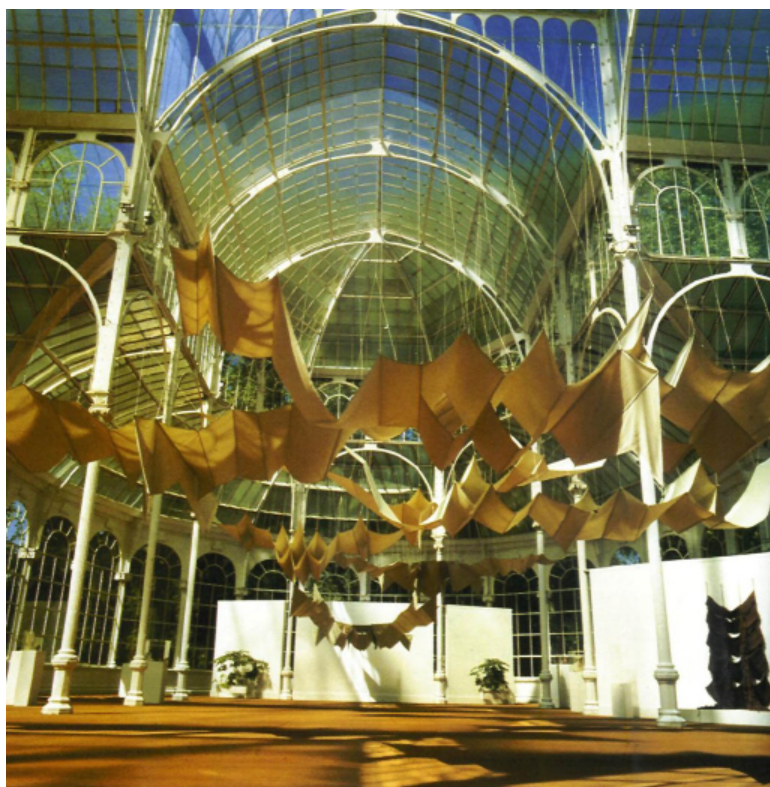
Ocells - estels, 1982 muntatge de veles al Palacio de Cristal, Madrid

Els seus treballs adquireixen dimensions monumentals de formes que recorden ocells i cometes, sovint integrats ja plenament en l'arquitectura.