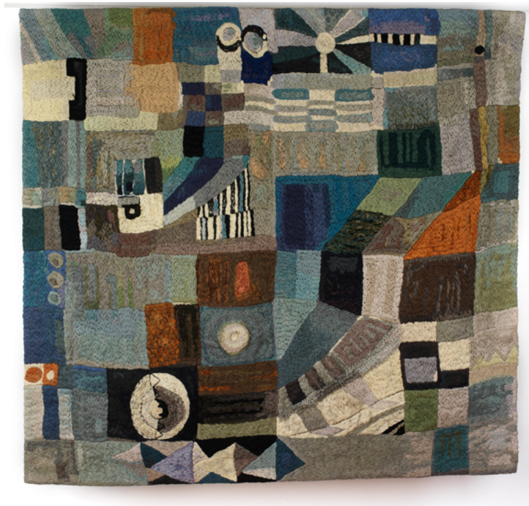
Ocell Blau, 1966

L'any 1965 és present a la Biennal de Lausana. A banda del reconeixement internacional que això suposa, aquesta experiència significa entrar en contacte amb d'altres artistes del moviment de renovació de l'art tèxtil anomenat Nouvelle tapisserie .