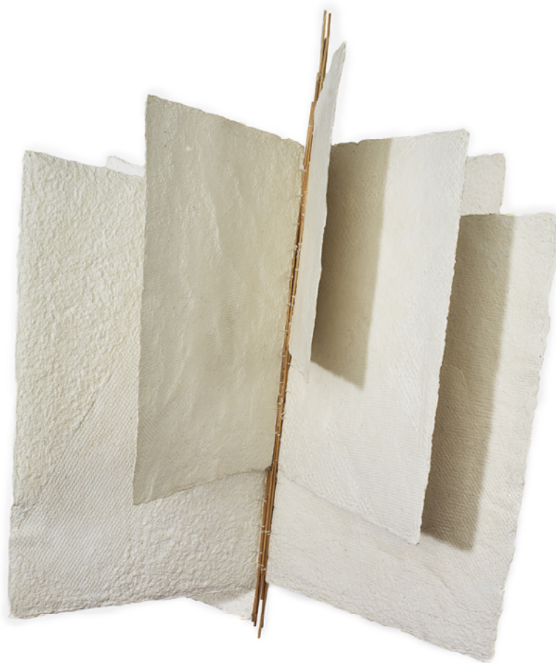
Llibre aeri , 1985 Paper

4. Als darrers anys de la seva carrera el paper esdevé l'element central dels seus treballs. El fabricarà ella mateixa a base de pasta de paper. Aquest “fer amb les mans” serà una constant que mantindrà al llarg del temps. El caràcter subtil, lleuger i mal·leable d'aquest material, i l'apropament a la tècnica oriental de l'origami generen últims treballs que incorporen la presència del moviment en l'espai.