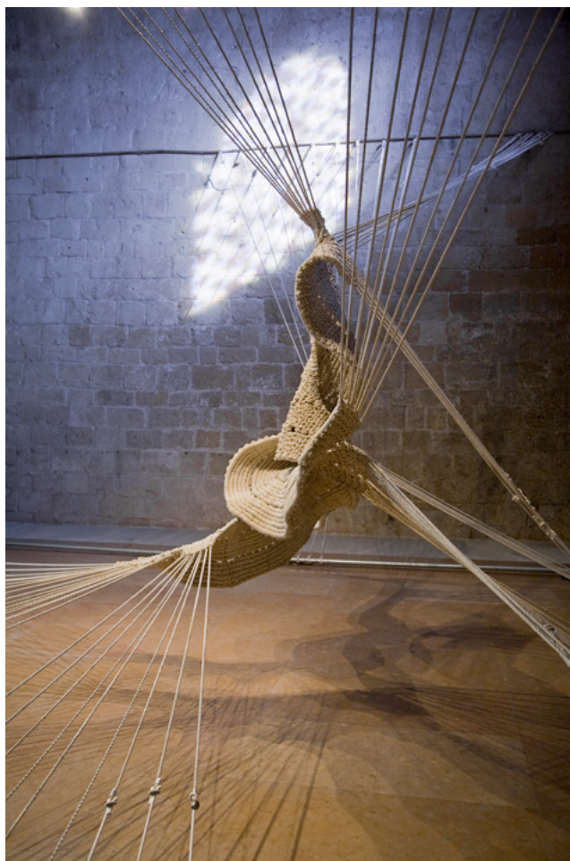
Cometa Ancorat, 1974 Macramé de cordes de niló

La tècnica del macramé esdevé central. Deslligat ja de la figuració, el treball a base de nusos fets amb cordes, jute o sisal permet crear peces tèxtils que van de la petita escala a les grans instal·lacions espacials.