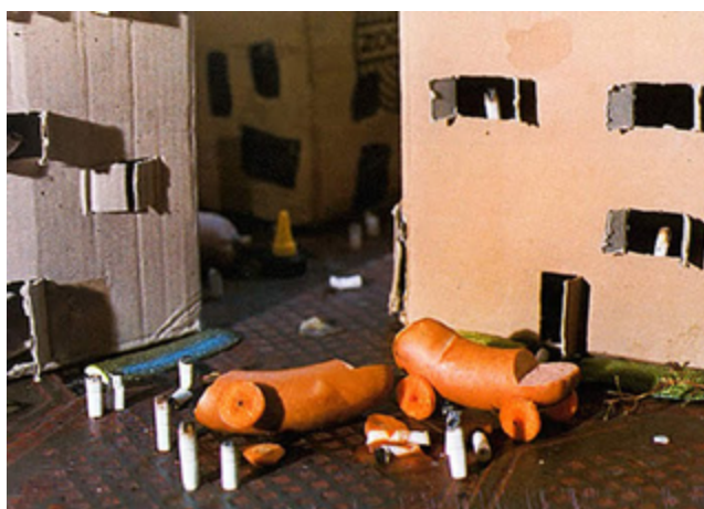
Sense títol (Salsitxa sèrie), 1979