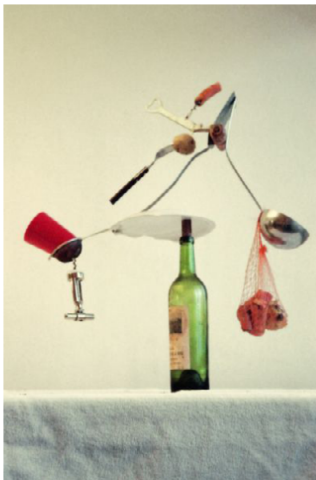
Comença un nou dia , 1984

4. En un món on sovint creiem que no tenim temps a perdre, potser val la pena aturar-se i preguntar-se a un mateix: “de quina manera perdré el meu temps avui?”. Retornar el poder a la quotidianitat, al temps present esdevé quelcom atractiu, ja que és allà on es troba la vida i per tant l'art. Equilibris, 1984–1986 son peces escultòriques que responen a la recerca de maneres creatives de perdre el temps. Aquestes escultures, fetes a partir d'objectes quotidians trobats a casa, busquen trobar l'equilibri que desafii a la gravetat l'estona suficient com per poder fer la foto. Com sempre, tot i l'aparent composició atzarosa, són fruit d'una molt acurada composició com si es tractés d'una natura morta.