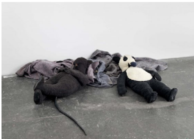
Sense títol (Rata i Ós, dormint) , 2008 Escultura de dues figures de drap, tres mantes de llana i dos motors

Ja als anys 2000, Rata i Ós es converteixen en part d'una escultura: Rata i Ós (dormint) , 2008 on podem veure als dos personatges estirats damunt d'unes mantes, descansant amb un lleu moviment que imita la seva respiració.