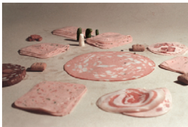
In the Carpet Shop (Salsitxa Sèrie), 1979