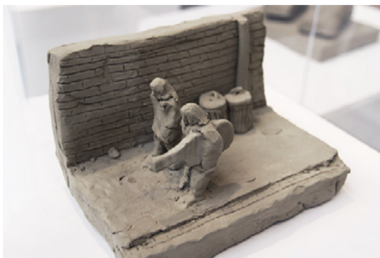
Mick Jagger i Brian Jones satisfets marxen a casa després d'haver compostat "I can't get no, Satisfaction".

De sobte aquest panorama (1981 – present) és una sèrie d'escultures de petit format, d'argila sense coure on els artistes proposen una compilació totalment subjectiva del coneixement universal a mode d'enciclopèdia. Sense cap rigor científic, elaboren els continguts a partir de conceptes que descriuen coses ordinàries (coses a la meva butxaca), o bé monumentals (el primer peix decideix sortir a terra). O allò apòcrif (set extraterrestres es meravellen davant Stonehenge) o incidents que esdevenen històrics (El Sr. i la Sra. Einstein poc després de la concepció del seu fill, el geni Albert). Sovint l'única pista que tenim per saber què representa la petita figura és el títol de la mateixa.