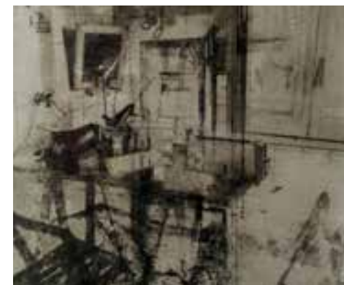
Anna Llimós, Palimpsest , 2019

INAUGURACIÓ I VISITA A L'EXPOSICIÓ, a càrrec de l'artista