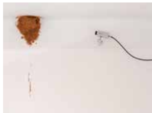
Rubèn Verdú, Swallow , 2008

INAUGURACIÓ I VISITA A L'EXPOSICIÓ, a càrrec del seu comissari